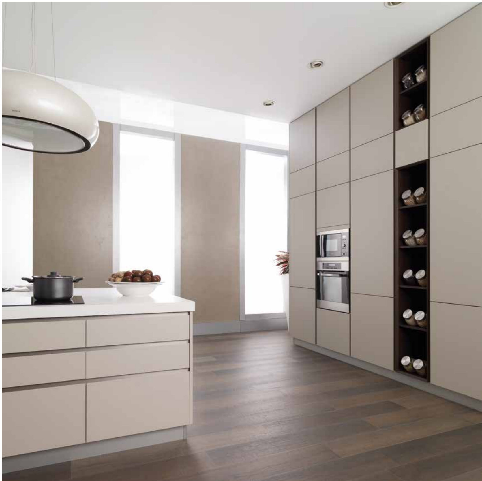
8 Residence Kitchen