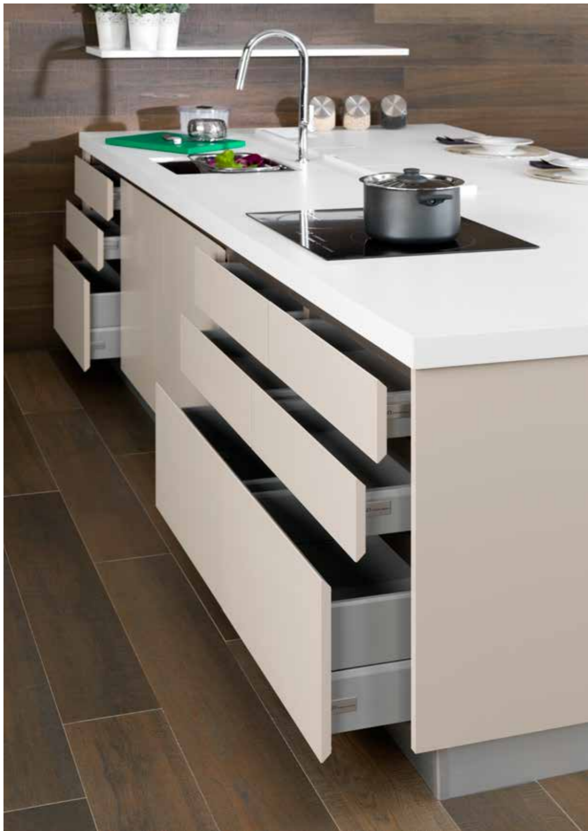
10 Residence Kitchen