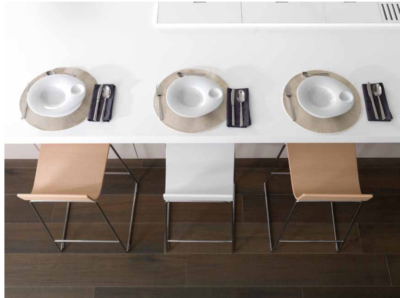
PORCELANOSA Grupo 11